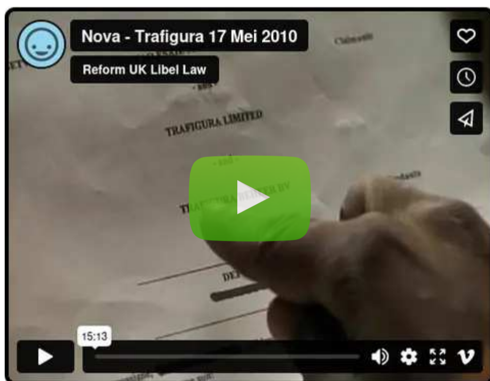
Vimeo | Trafigura juhid: "Meid altkäemaksu anti"

“ Vimeo kommenteerija: ‘Täname, kes iganes sa oled, et seda kättesaadavaks tegid. Nagu teate, siin Suurbritannias meil pole lubatud seda lugeda ega näha.’